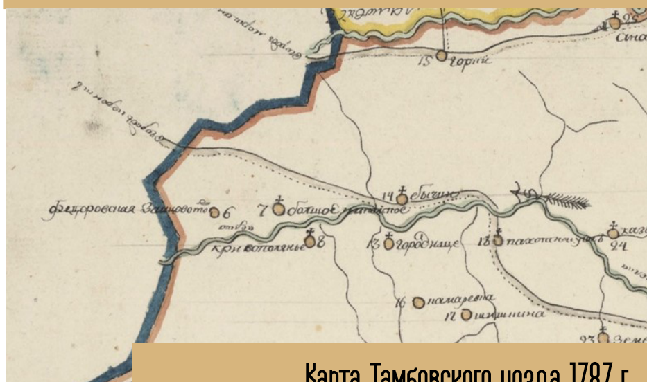
Карта Тамбовского цезда 1787 г.

Федоровский гончарный промысел зародился в деревне Федоровка, Тамбовского уезда в середине XVIII века (сейчас относится к Бондарскому району Тамбовской области). Деревня Фёдоровка Тамбовской области Бондарского района Кривополянского сельского совета впервые указана на карте Тамбовского уезда 1787 года под названием: «Федоровская Зайцовото».